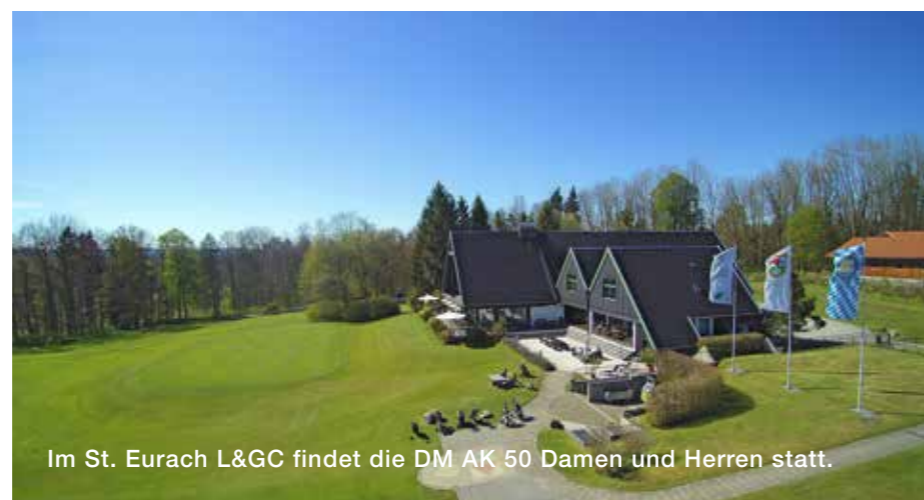
Im St. Eurach L&GC findet die DM AK 50 Damen und Herren statt.

Es starten nicht nur zahlreiche bayerische Teams in den Spielbetrieb der Deutschen Golf Liga presented by All4Golf, im Freistaat finden auch eine Menge hochkarätiger Turniere mit Top-Golf zum Anfassen statt. Dabei steht das Wochenende 17./18. Mai im Zeichen der Bayerischen Meisterschaft AK 30 Damen/Herren im GC Schloß Maxlrain und der Bayerischen